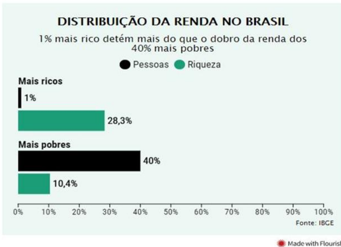
Figura 02 – Distribuição da Renda no Brasil.