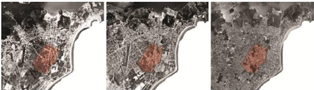
Figura 1 - Ocupação de Vila Velha em 1970, 1978 e 1998 ( www.veracidade.com.br , adaptado pelos autores.

Entre as décadas de 60 e 70, a população de Vila Velha quase dobra, atraída pela industrialização da capital e pelo declínio da economia cafeeira. Porém, Vila Velha só teve seu desenvolvimento consolidado a partir da década de 70, quando empresas e pequenas indústrias se instalaram no município, tornando-o mais atrativo e permitindo assim sua expansão. A Figura 1 ilustra a expansão da ocupação do solo nas três últimas décadas do século XX com a multiplicação de vias e edificações ocupando os vazios existentes. Realidade que difere do processo de urbanização da capital, impulsionado desde 1960 a partir do plano do novo arrabalde que previa a preservação de áreas de equilíbrio ambiental e conexões que valorizavam marcos visuais da região (PIMENTEL, 2005).