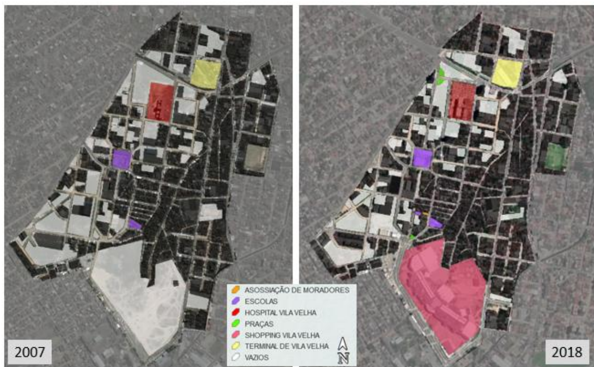
Figura 2 - Evolução do bairro Divino Espírito Santo (Elaborado pelos autores, 2018)

Essa situação, presente no ano de 2007, data em que o penúltimo plano diretor foi aprovado, se mantém atualmente. Porém, nesse período, as novas ocupações ocorreram por edifícios verticais e o shopping, que trouxe modificações intensas no desenho do bairro.