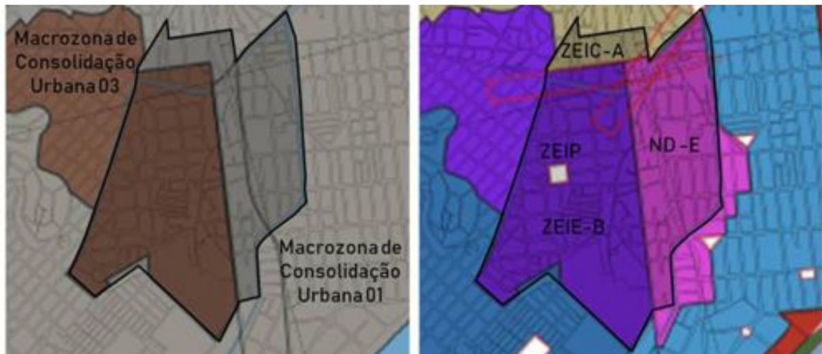
Figura 4 - Macrozoneamento e zoneamento. (VILA VELHA, 2017, editado pelos autores)

Quanto ao zoneamento (Figura 4), a área de estudo passa a pertencer a duas macrozonas (Macrozonas de Consolidação Urbana 01 e 03). Em ambas as macrozonas aparecem a ideia de ocupar os vazios urbanos e interliga-las ao restante do território, porém apenas na Macrozona de Consolidação Urbana 01 a preservação dos espaços públicos aparece como objetivo.